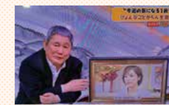
TBS「ニュースキャスター」