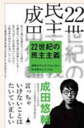
成田悠輔氏の新著『22世紀の民主主義』に紹介