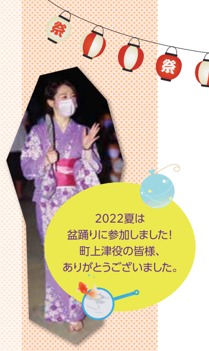
2022夏は盆踊りに参加しました! 町上津役の皆様、ありがとうございました。

政務活動費を有効活用するため固定拠点なしのシェアオフィスを利用しています。(事務所・人件費削減→市政報告費用へ充当中)