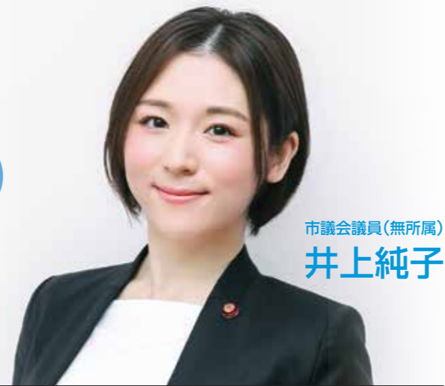
市議会議員(無所属) 井上純子