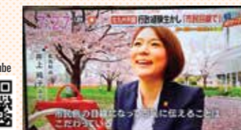
KBC「アサデス」～情報発信を頑張る地方議員～として紹介されました