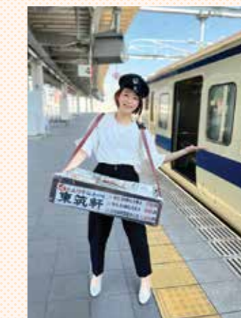
折尾名物「かしわめし」を販売体験してみました♪